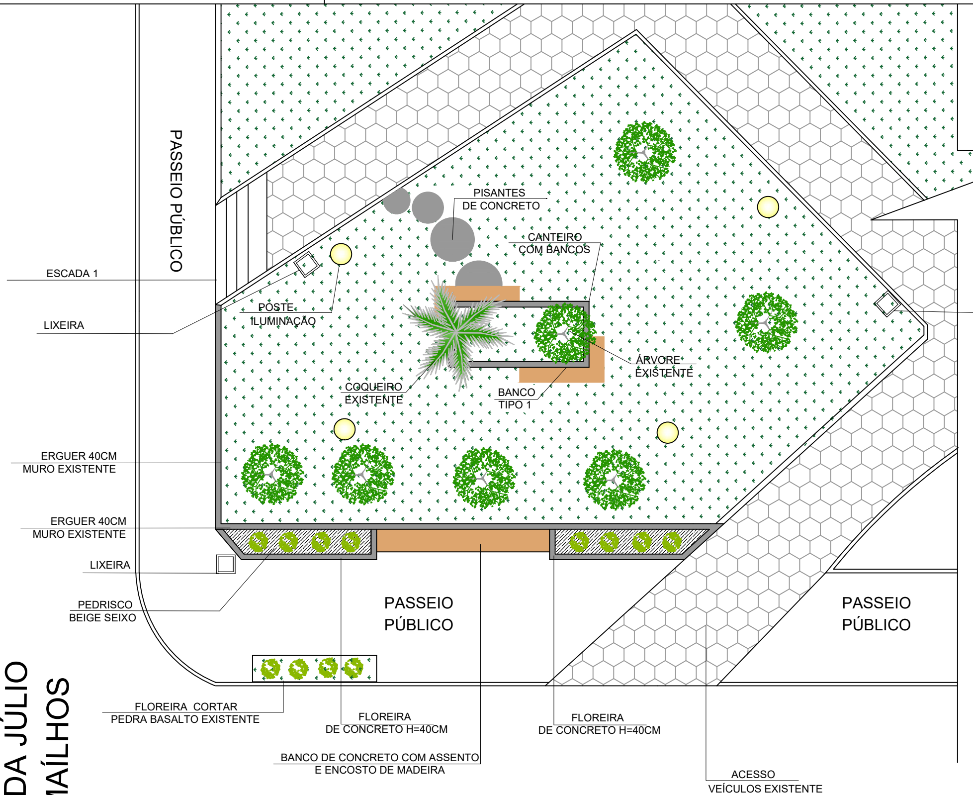
1 CANTEIRO 1 - PLANTA BAIXA ESC. 1/100